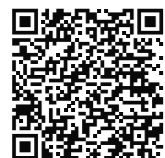
MCompact Systemlager für Palettenhandling

Bauhöhe: Bis 9 m (7,5 m Oberkante Ladeinheit) Traglast: Max. 1.000 kg Länge x Breite: 40 m x 13,5 m Lagerkapazität: Rund 1.340 Europaletten Umschlag: Bis zu 25 Doppelspiele/h Kranfahrgeschwindigkeit: Bis 80 m/min Katzfahrgeschwindigkeit: Bis 30 m/min Hubgeschwindigkeit: Bis 45 m/min Lastaufnahmemittel: Gabelzinken