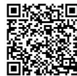
Film: MSequence - Sortierpuffer für den Warenausgang